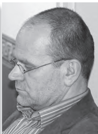
Gyüdi Sándor Szegedi Szimfonikus Zenekar