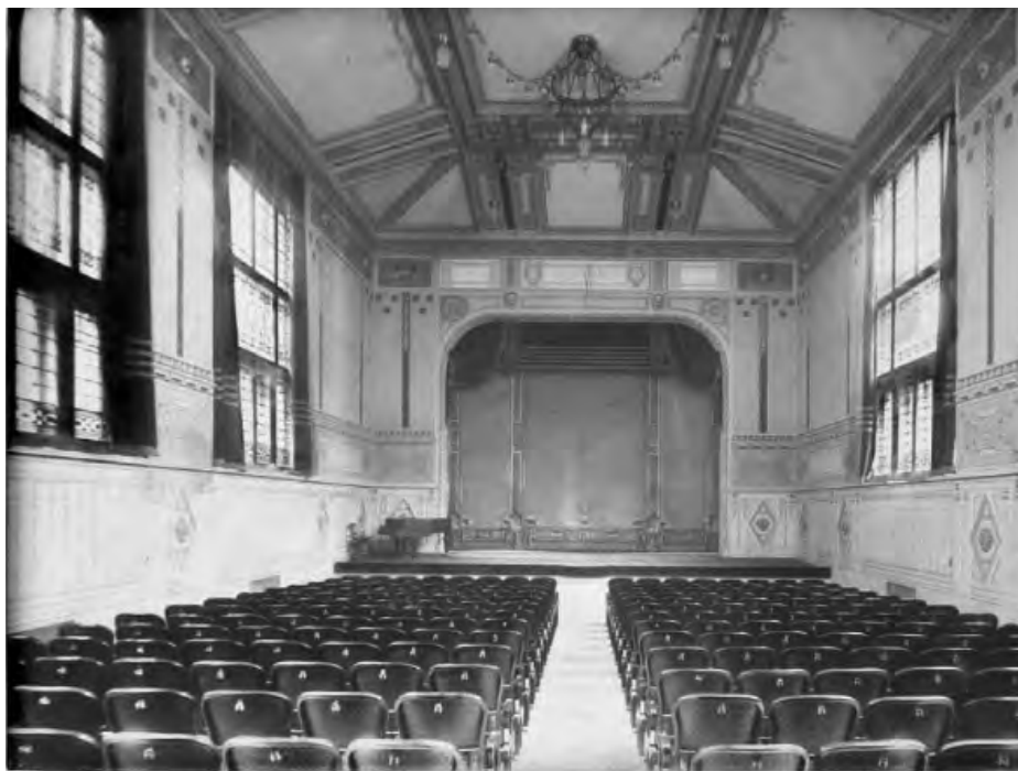
A Kisterem archív fényképe az eredeti csillárral, a nézőtérrel nézve. A színpad bätterében az eredeti, díszes kidolgozású vasfüggöny látható

– Az elég szerencsétlen beépítésű jelenlegi női öltöző helyett a belső udvarban lesz a közönségbüfé, amely délelőttként művészbüféként fog működni. Tehát a főbejárat melletti büfé megszűnik, amitől egy kicsit „fellélegezhet” az előcsarnok. Ennek az épületnek közönségforgalmi szempontból nagy hátránya, hogy az előtér viszonylag kicsi. (Nem véletlen, hiszen Korb Flóris és Giergl Kálmán eredeti tervében a Zeneakadémia épülete a körútig tartott volna. Mivel az akkor már ott álló bérházat nem sikerült megszerezni, viszonylag szűkösebb adottságú telekkel kellett gazdálkodni.) Az első