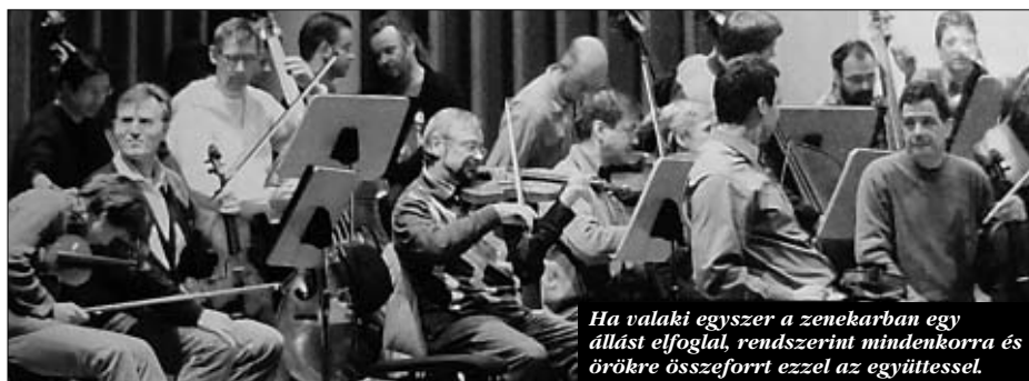
Ha valaki egyszer a zenekarban egy állást elfoglal, rendszerint mindenkorra és örökre összeforrt ezzel az együttesel.

Ha hiszünk a munkaerő-piac szakértők nyilatkozatainak, úgy a kevés munkaadóra szorító karrierút lassan búcsúzik. Manapság azok az életrajzok a kelendő, amelyek magas változatosságot és flexibilitást ismertetnek. Az állásváltoztatások németországi vizsgálata azonban ennek ellentmond. Nevezetesen, a várakozással ellentétben, a