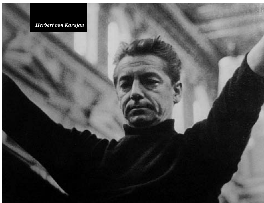
Herbert von Karajan

A zeneközvetítés új formáiról, mint például beszélgetős koncertekről vagy valóságos ifjúsági munkáról nemigen esett szó. Általában hiányzott a szisztematikus, például témaorientált munka, a programokat túl rövid időre vonatkozóan állították össze. Még Karajan sokat dicsért próbatevékenysége is lassan támadás célpontja lett. Az idők folyamán keményebbé és kérelhetetlenebbé vált, szinte diktatórikus megnyilvánulásokkal vádolták. Végül rendszeres hatalmi har-