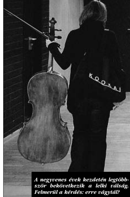
A negyvenes évek kezdetén legtöbbször bekövetkezik a lelki válság. Felmerül a kérdés: erre vágytál?

kétszer is meggondolja a kreatív önmegvalósítást. Ami van, az van. Nem csoda, hiszen aki muzsikuspályára lép, belemegy a kiszámíthatatlanságok játékaiba és vállalja a magas biográfiai rizikót. A művészet értéke mindig is csupán egy megállapodás eredménye volt. Közönség nélkül, amelyik kész a zenei élvezetekért pénzt adni, szó szerint „kenyér” nélkül maradna.