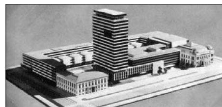
Az ÁÉTV tervnek a Rádió jelenlegi telephelyére szánt makettje. (Nánási Sándor, 1966.)

A Rádió műsorstruktúrája időközben módosult (megjelentek a kereskedelmiek