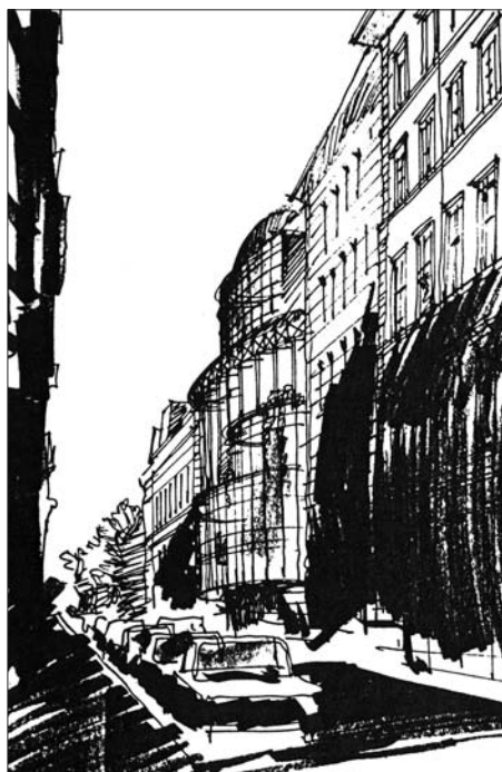
A tervezett koncertterem Múzeum utcai homlokzata

A 90-es években a kérdést hangmérnöki oldalról ismét felmelegítettük ugyan, ám próbálkozásunkat most meg a tervezett Világkiállítás ürügyén az illetékes