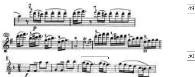
22 Originelle, Ungarische Nationaltänze, Bécs 1806–1807, 8. szám

A G-dúr koncert 85. ütemében a pontozott ritmika hetyke előkével történő variálása kezdődik (vö. 44., 45., 46. kotta), majd folytatódik a következő két ütemben, a verbunkos tánc jellegzetes ritmikai eszközeivel (vö. fuvola-hárfa-verseny 1. tétel, 15. ütem):