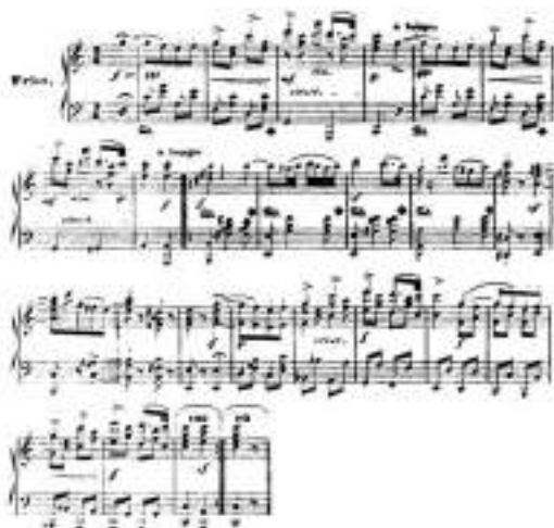
Mosonyi Mihály: Galgóczi emlék (részlet)