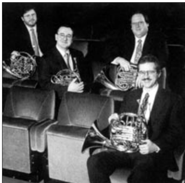
Mi motiválja a zenekari muzsikuskot?

Emellett az eredményben az is megmutatkozik, hogy a muzsikuskok a zenekarok művészi kvalitásait állandóan magasra értékelték: a megkérdezettek több mint fele a zenekari színvonalat összességében inkább magasra értékelték. Különösen a közönség elégedett a minőséggel, itt a zenekari színvonal 80%-ban magas minősítést nyert. Másrészt világossá vált, hogy maguk a zenekari muzsikuskok zenekaruk teljesítményét általánosságban kevésbé jónak értékelik. Míg a zenekaron kívüli személyek kétharmada (69%) összességében igen elégedett a zenekar színvonalával, a zenekari muzsikuskoknak csupán alig több mint a fele (54%) gondolkodik így. A zenekari muzsikuskok tehát zenekarukat