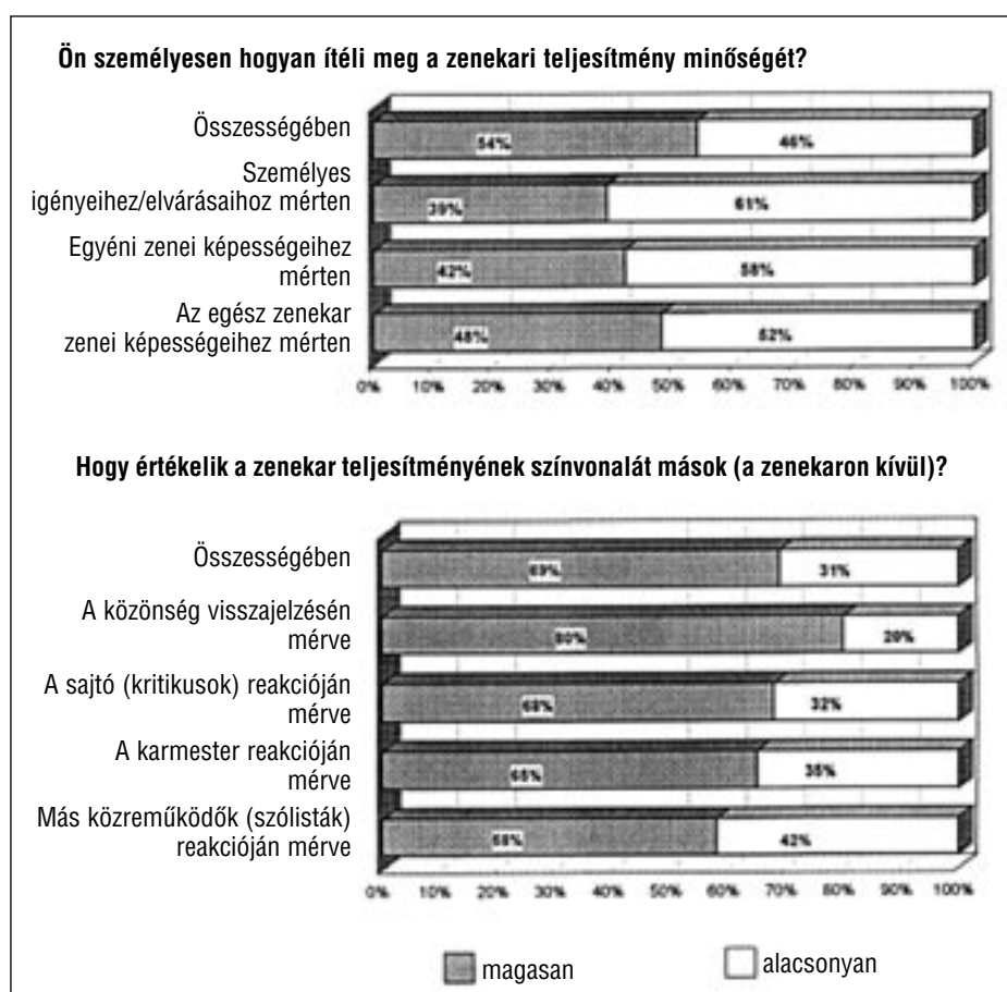
2. grafika: A zenekarok művészi kvalitásának megítélése

Kevésbé fontosnak találták a zenészek ezzel szemben a darabbal való azonosulást és a karmester előadásmódját, valamint a dirigens kollegiális bánásmódját. Összehasonlításképpen végül is nem fontos az egyéni hozzájárulás méltánylása és az ebből fakadó személyes karrier. Ebben persze különbség van a szólisták és a szólamvezetők esetében: ez a két aspektus az előbbieknél elvárhatóan nagyobb szerepet játszik, mint a tuttitáknál. Azonkívül különbség van az egyes hangszer-csoportok között is: a személyes karrierre vonatkozó