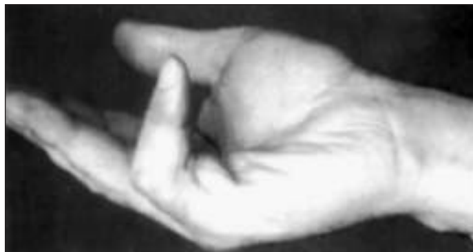
A „Dupuytren” jelenség késői stádiuma: a kisujj 70 fokos behajlása a középipületben, enyhe behajlás a többi ujj alapizületében.

korai akadályoztatást idéznek elő. Ezekben az esetekben az előfeltételek olyan sokfélék lehetnek, hogy ezek taglalására itt nem vállalkozhatunk. Általánosan igaz azonban, hogy a sebészi beavatkozásnak a korábbi anatómiai állapotot kell precízen helyreállítania, vagy legalábbis a további romlást megakadályoznia