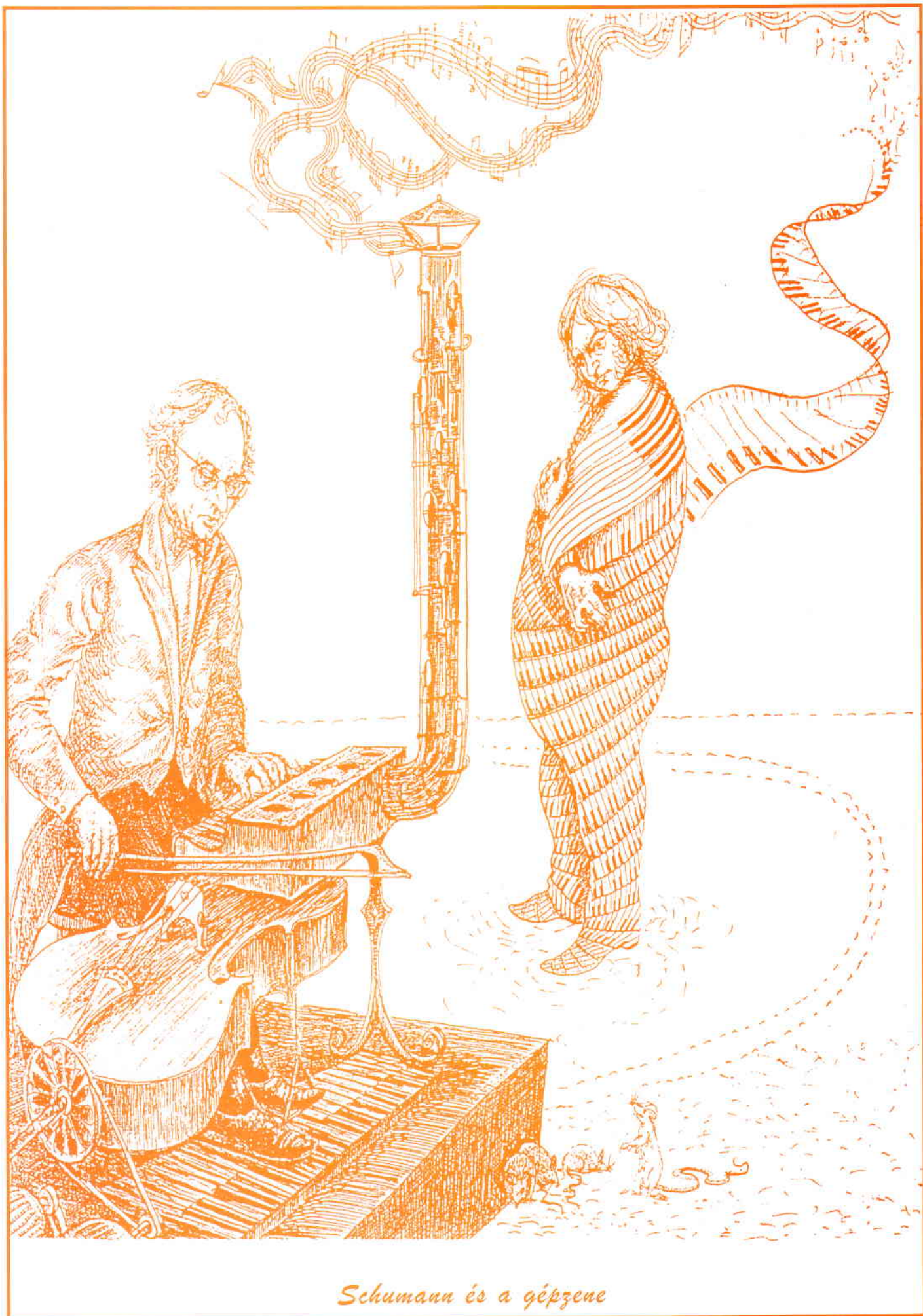
Schumann és a gépzene