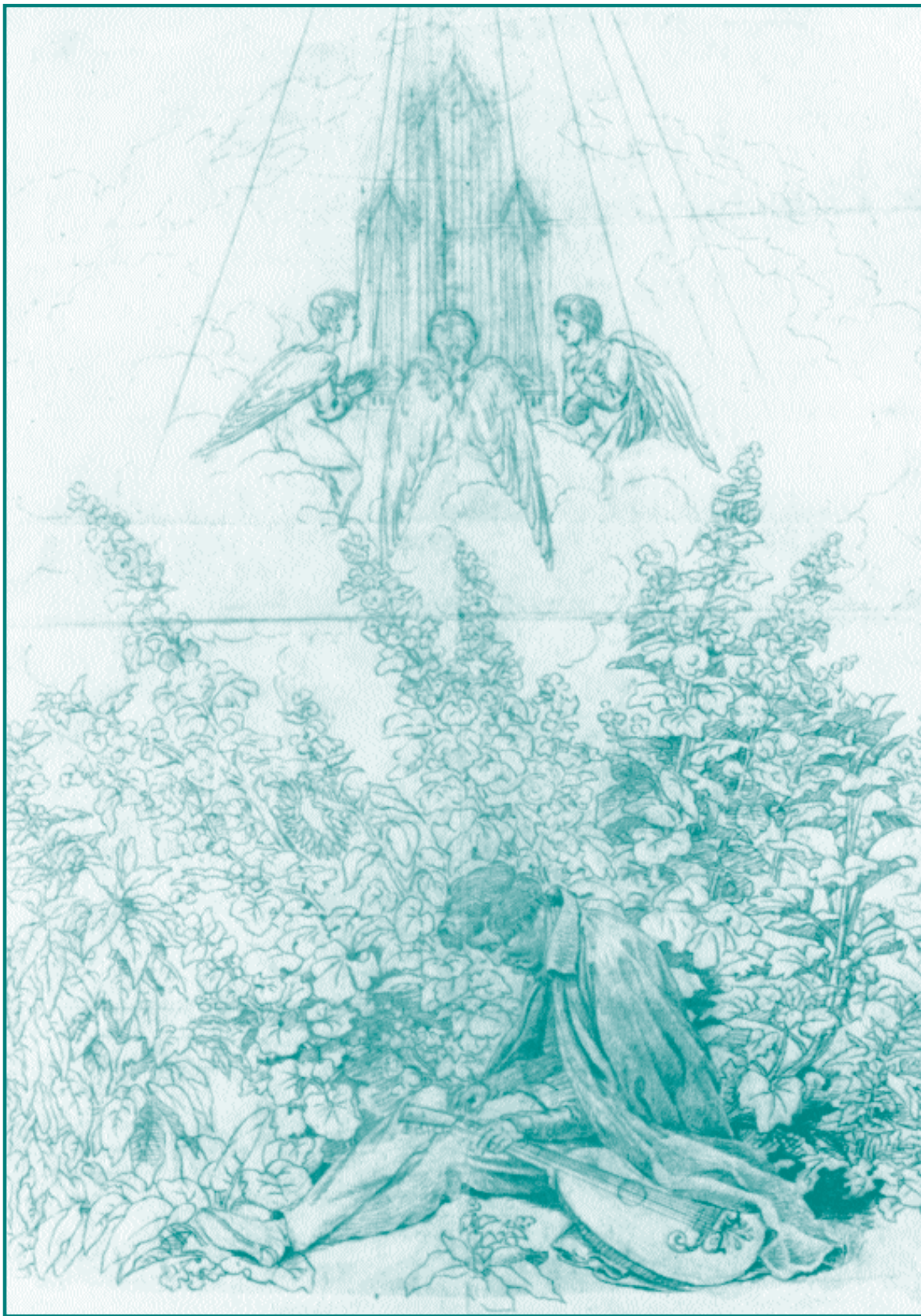
Caspar David Friedrich (1774–1840): A muzsikus álma