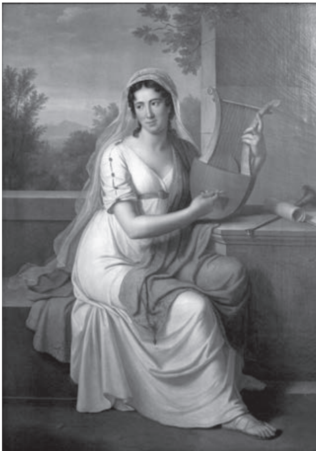
Heinrich Schmidt: Isabella Colbran énekesnő portréja