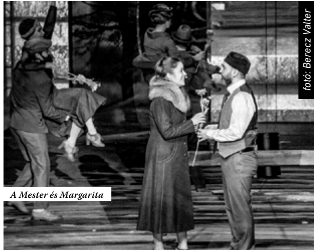
A Mester és Margarita

– Évezredekken keresztül rendkívül sokat jelentett az emberiségnek a ritmus. Mindenféle zene elfér egymás mellett, és mindenféle zenének lehet értelme és lehet magas művészi színvonalú. A könnyűzenei elemekkel azért próbálkozunk nagyon sokan, azért próbáljuk megtalálni a közös pontokat a komolyzenével, mert egyrészt azt gondoljuk, hogy mesterséges, ahogy a zenének ez a két ága ennyire szétvált. Nem létezik, hogy a 20-21. század két típusú zenéjének egyáltalán ne legyen köze egymáshoz, másrészt pedig mert a ritmikájával, a harmóniameneteivel nagyon fontos művészi erőforrás tud lenni. Nekünk, magyaroknak ezen kívül fontos inspirációforrás két óriásunk, Bartók és Kodály népzenehez való fordulása. Miközben nagy büszkeség, legalább ekkora probléma is, hiszen ők már szinte mindent kihoztak ebből, amit lehetett. Ez persze nyilván nem igaz, a magyar népzene olyan magas művészi színvonalú, hogy inspirációforrásként szinte kimeríthetetlen. Ott vannak Bartóknak azok a zenéi, amelyekben a népzenei nyelvet, a népdal logikáját, harmóniameneteit és gondolkodását úgy dolgozza bele a saját művészetébe, hogy kétségtelesen ráismersz a népzenei hatásra, de nem egy konkrét népdalfeldolgozás, hanem egy sajátos új zenei nyelv születik belőle. Ha ilyen szempontból nézem, akkor a népzene egy hatalmas erőforrás, erőtartalék megújulás