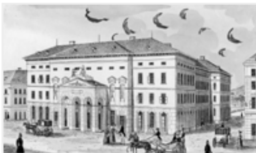
A pesti Városi Színház a mai Vörösmarty téren, 1830 k.

Ugyanerre lehetünk figyelmesek Rózsavölgyi Márk (1789–1848) önéletrajzának a század elejére vonatkozó szakaszában, amelyben a kvartettek szerepéről is megemlékezett: „Tizenkét éves koromban elkerültem hazulról; Nyitrára, majd Pozsonyba mentem tanulni, de állandóan azon igyekeztem, hogy mentől hamarabb a magam ura lehessenk [...]. Nagy tehetségem volt a hegedüléshez, de ahhoz kevés volt a pénzem, hogy mestert fogadhassak, aki tanított volna, ezért olyan házaknál igyekeztem magam megkedveltetni, ahol muzsikáltak, kvartetteztek, s szükségből a másodhegedűre is vállalkoztam. [...] már 1808-ban jó hegedűs lettem. Ekkor visszautaztam Pestre, s tekintélyes évi jövedelemmel állást vállaltam egy nagykereskedőnél mint könyvelő. [...] Mivel fáradhatatlanul tanulmányoztam a generálbasszust és a zeneszerzést, e magyar szerzemények mellett más klasszikus kompozíciókat is írtam: vonósnegyeseket, több variációt hegedűre zenekari kísérettel, néhány koncertdarabot...” 9