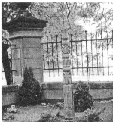
Kopjafa (az avatáskor) Vác, 2002. szeptember 27.

A délelőtti programban emléktábla-leleplezés, a Cházár-szobor koszorúzása, zászlóátadás-, avatás, kopjafa-szentelés, iskolatörténeti kiállítás megnyitása és a bicentenárium tiszteletére megjelent kiadványok bemutatása szerepeltek.