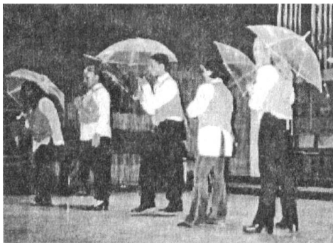
Kultúrműsor a jubileumi rendezvényen (Vác, 2002. szeptember 27.)

Szívből gratulálunk az emlékoszlop készítőjének!