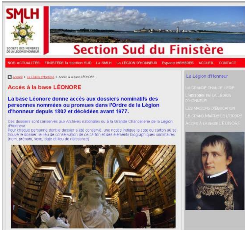
A Léonore adatbázis kezdő oldala

Manapság már tíz millió amatőr kezdett bele családfakutatásba az internet segítségével, több mint négy milliárd őst vittek fel a Geneanetre, és minden második ember legalább egyszer rákeresett a családfakutatásra vagy a családnevekre. Több mint 300 általános vagy szakosodott genealógiai társaság jött létre, és szervez szalonokat az egész év folyamán Franciaország minden régiójában. A megyei levéltárak (hármát kivéve) már online hozzáférhetővé tették anyakönyveiket a 16. századtól kezdődően mintegy 1914-ig. A tematikus adatbázisok száma rohamosan nő: a legismertebb a katonai vonatkozású Háborús hősök 5 adatbázisa és a Léonore adatbázis, 6 amely a becsületrenddel kitüntetetteket jegyzi 1802-től az 1977 előtt elhunytakig bezárólag. 7