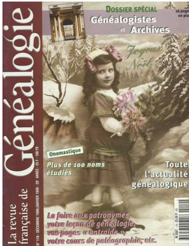
Revue française de généalogie címoldala

közel 300 genealógiai szervezet létezett, és az Ifop (Institut français d'opinion publique) 1999-es felmérése szerint 1,9 millió volt azoknak a száma, akik belekezdtek családfájuk elkészítésébe.