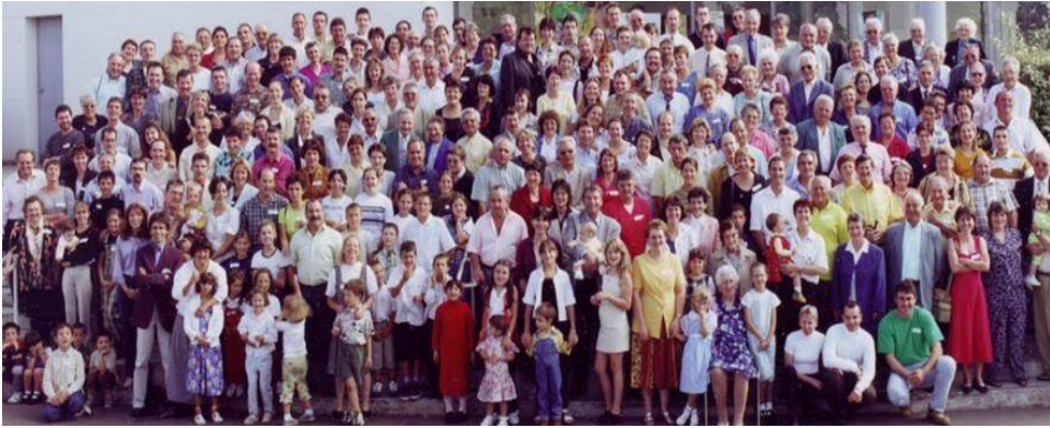
Az unokatestvérség csoportkép

2015-ben a genealógia iskolai tantárggyá vált az általános iskolákban, mivel elősegíti a 6-10 éves gyerekekben a kronológia és a történelmi időérzet fogalmának megértését.