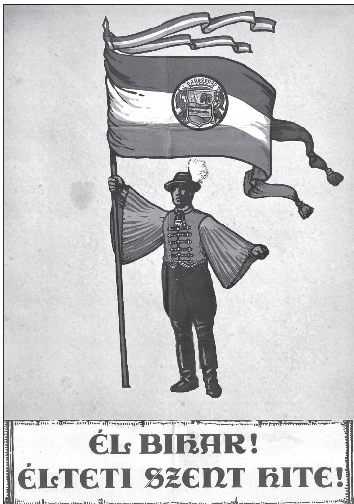
Haranghy Jenő Leventeverseny plakátja