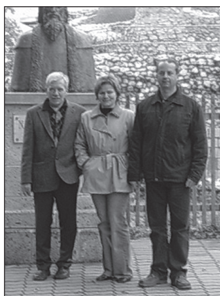
Ódor Imréék társaságában