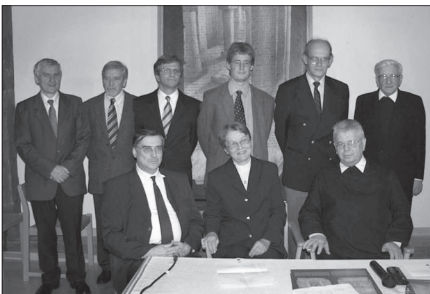
A tihanyi alapítólevél-konferencia előadói, 2005