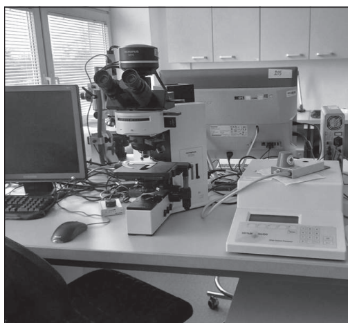
Polarizációs mikroszkóp állomás