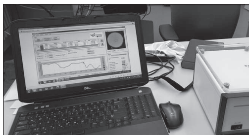
SurveNIR papír vizsgálata