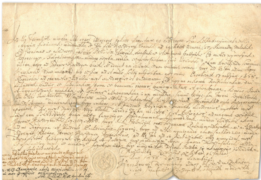
1. Tudósítás a templom leégéséről, 1678