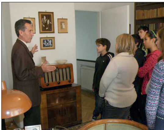
Somogy Megyei Levéltári Nap, 2005

munkában lelkesedéssel dolgoztam, mivel Nagy Imre miniszterelnök történeti szerepe a rendszerváltás óta érdeklődésem középpontjában állt, és motivált az a tény is, hogy apja Ötvöskönyiben született. A későbbiekben, 2017 folyamán felelős szerkesztőként valamint a kötet egyik szerzőjeként vettem részt az Ötvenhat Somogyban című kétkötetes levéltári kiadvány elkészítésében. A 2017-ben megjelent kötet már nemcsak mint forráskiadvány jelent meg, hanem az iratok közlése mellett esettanulmányokat is tartalmazott. Több írásom a megyei forradalmi események kapcsán, általános és egyedinek mondható kérdésekről, eseményekről a levéltári évkönyv mellett országos folyóiratokban is megjelent. Az 1956-os események mind a mai napig érdeklődésem, jelenleg is zajló kutatásaim elsődleges szelét adják. Az általam készített levéltári segédletek közül a Kaposvári Városi Tanács testületi üléseinek 1950 és 1990 közé eső napirend-katalógusát emelném ki, amely 2005-ben jelent meg a Somogy megye múltjából – Segédletek kiadványsorozatban. A helytörténeti irányultságú kutatásokat is rendkívül fontosnak tartom: négy önálló községtörténeti kiadvány elkészítésén túl egyik szerzője voltam több helytörténeti monográfiának is. Külön öröm volt számomra, hogy a szülőfalum krónikáját feldolgozó, 2020-ban Ötvöskönyi – Nyolc évszázad krónikája címmel megjelent helytörténeti monográfia egyik ötletgazdájaként és szerzőjeként szerepeltem.