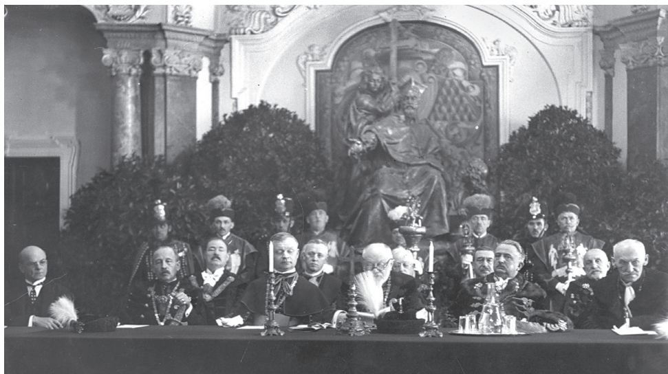
2. A Pázmány Péter Tudományegyetem vezetősége, 1928