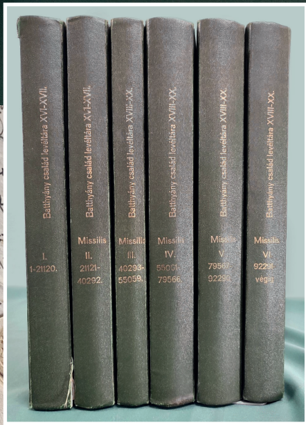
Kollázs és montázs a Batthyány-levelekből és mutatókönyveiből (Fotó: Avar Anton)