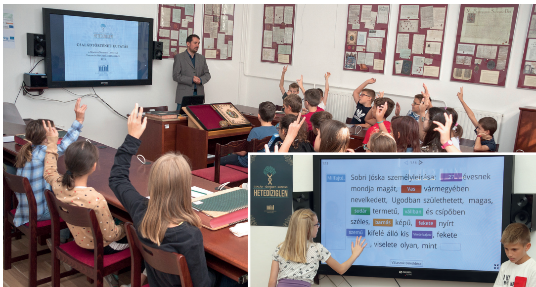
Levéltár-pedagógiai foglalkozás a Veszprémi Báthory István Sportiskolai Általános Iskola tanulói részére