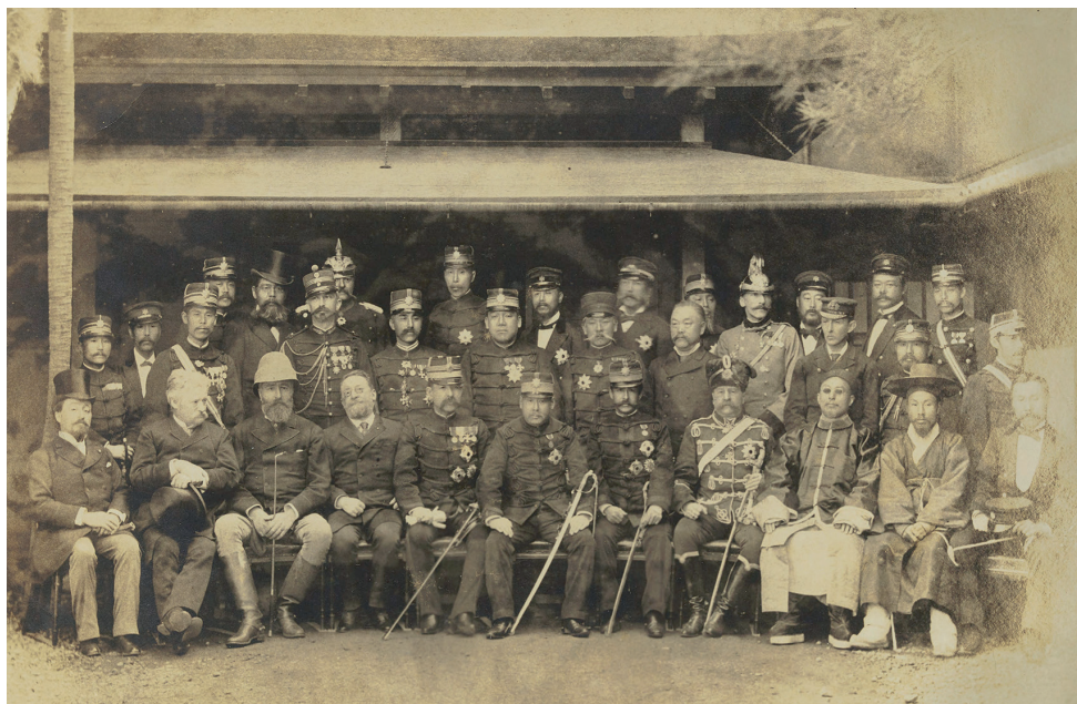
3. Polgári és katonai tisztviselők az Arisugawa-palota előtt (1890)

mint japán, kínai és nyugati tudósok, valamint a japán kultúra és történelem formálásában jelentős szerepet játszó személyek irathagyatéka. A Császári Ház Könyvtára is ehhez a részleghez tartozik, amely történeti jellegű, túlnyomórészt a császári családtól és az udvar tagjaitól származó gyűjteményekből álló könyvtári állományt őriz.