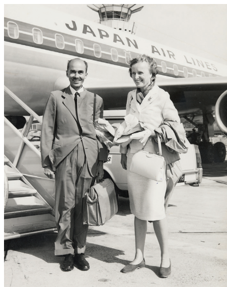
8. Habsburg Ottó és Regina a párizsi repülőtéren, a Japánba tartó gép előtt (1966)

Az IHA székhelye a tokiói császári palota parkos területén található, a Császári Ház Levéltárának szomszédságában, szemközt a Japán Nemzeti Levéltár főépületével. Miután az IHA-t az utóbbi időben számos bírálat érte, amiért elszigeteli a császári család tagjait a japán közvéleménytől, és mert mereven ragaszkodik a szigorúan megőrzött szokásokhoz, érthető, hogy – külföldi kutatóként – némi aggodalommal léptünk be a bürokrácia útvesztőjébe. A levéltári munka során további kihívást jelentett, hogy a munkatársak – az országos tendenciának megfelelően – csak nagyon alacsony arányban beszélnek angolul, így igencsak hálásak voltunk a korábról ismert japán segítőknek a tolmácsolásért és a helyi viszonyokban való eligazításért.