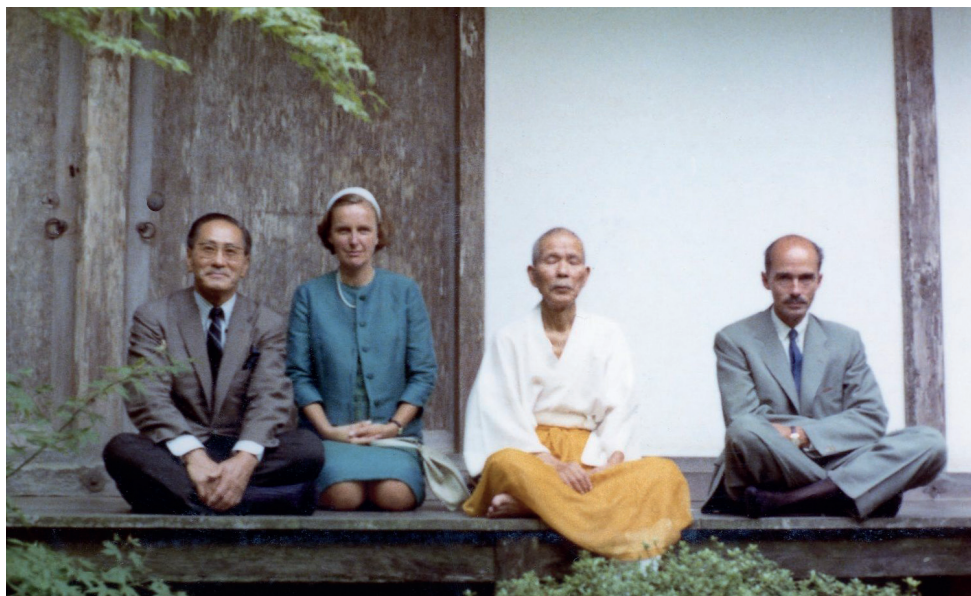
9. Habsburg Ottó látogatása a Daitokudzsi templomnál Kiotóban (1966)

Az iratokat nagyjából három héttel az érkezésünk előtt kikértük, előzetesen leadtuk a kutatók nevét, és lefoglaltuk a kutatótermi helyeket. A császári palotához érkezve így is csak alapos regisztrációs eljárást követően, fegyveres őrség kíséretében léphettünk be az épületbe, ahol azonban a lepakolás és a kutatótermi papucskok átvétele után már hozzá is férhettünk az előkészített iratokhoz.