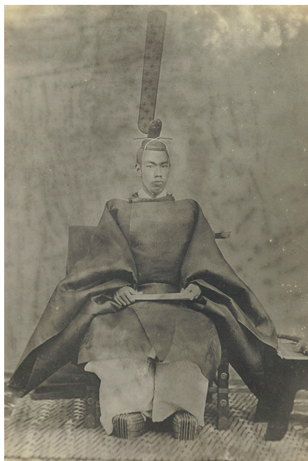
1. Meidzsi császár (1872)