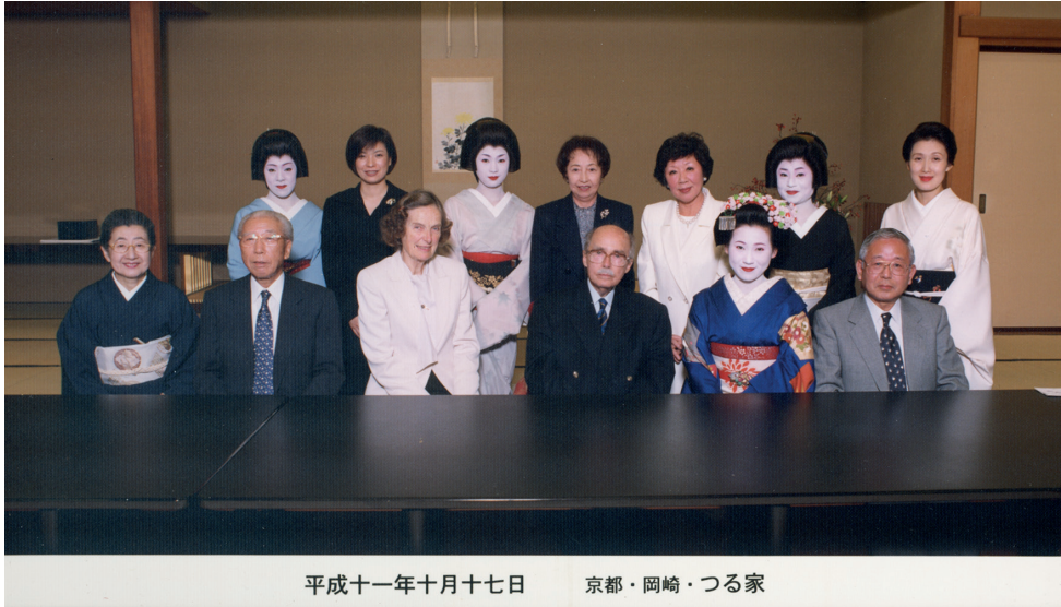
平成十一年十月十七日 京都・岡崎・つる家

10. Habsburg Ottó és Regina látogatása Kiotóban az Okazaki Tsuruya étteremben (1999)