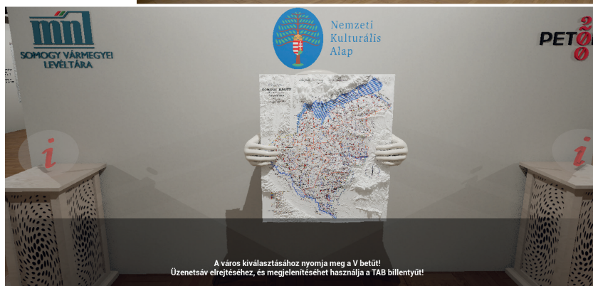
A város kiválasztásához nyomja meg a V betűt! Űzenetszív elrejtéséhez, és megjelenítéséhez használja a TAB billentyűt!