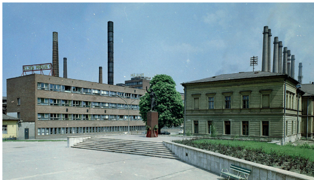
Az Erőmű (ma Digitális Erőmű) épülete.