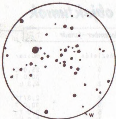
15,2 T 56x LM = 43'