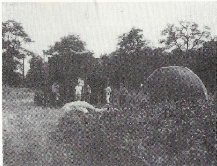
Az épülő tápiószelei csillagvizsgáló (öt éves a TCSBK c. cikkünkhöz)