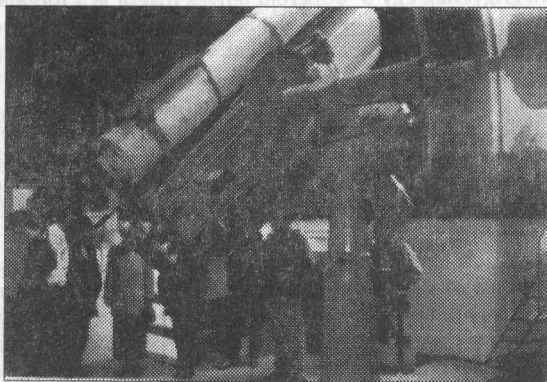
A Kleti Bemutató Csillagvizsgáló 57 cm-es távcsöve

Az előadásokat, beszámolókat a hallgatók nagy érdeklődéssel kísérték. Az elmúlt időszak eredményes észleléseiről, a megfigyelések redukációjáról, műszerekről, a mostani problémákról hallhattunk éppúgy, mint a tervekről, észlelési programokról stb. Az előadásokból leszűrhető, hogy az európai amatőrök lehetőségei évről évre bővülnek, sőt, már elérték az amerikai szintet.