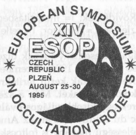
A prágai Stefanik Csillagvizsgáló (balra) és a rendezvény emblémája (jobbra)

Az előadásokat, beszámolókat a hallgatók nagy érdeklődéssel kísérték. Az elmúlt időszak eredményes észleléseiről, a megfigyelések redukációjáról, műszerekről, a mostani problémákról hallhattunk éppúgy, mint a tervekről, észlelési programokról stb. Az előadásokból leszűrhető, hogy az európai amatőrök lehetőségei évről évre bővülnek, sőt, már elérték az amerikai szintet.