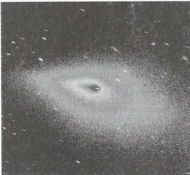
Az SW-3 1995. dec. 13-án (a felvétel a 3,5 m-es NTT-vel készült)

A tyúk és a tojás örök kérdésére utalva elmondhatjuk, hogy esetünkben a kitörés volt előbb, a szétszakadás csak a drasztikusan megnövekedett aktivitás eredménye. (Ellenkező példa a P/Shoemaker–Levy 9 esete, ahol a szétszakadás eredményezte a fényességnövekedést.) Az elmélet szerint a magon, melynek átmérője a korábbi észlelések szerint 3 km körül lehetett, egy hasadék keletkezett, amely a mostani napközelség időpontjára tágult ki annyira, hogy friss, jégben gazdag rétegek is a felszínre kerüljenek. Közeledve a Naphoz, két héttel perihéliuma előtt kezdett jelentősen párologni, ám a hasonló esetekkel ellentétben viszonylag lassan emelkedett az aktivitás. Néhány nap helyett egy hónapos, folyamatos aktivitás-emelkedés következett, ami alátámasztja, hogy a kitörés egy kicsi forrásból terebélyesedett szét. A növekvő anyagkibocsátás mélyítette a szakadékat, ami aztán a mag szétesését eredményezte. Egy sokkal érdekesebb elképzelés szerint az elnyúlt magon egy megfelelő helyen lévő aktív folt a rakétaelv alapján úgy felpörgetheti a magot, hogy azt a centrifugális erő széttepi.