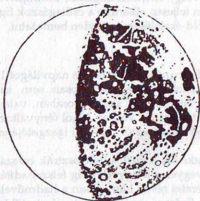
1. ábra. A Hold 1696. július 10-én 20 órakor Szegeden. Növekvő Hold (újhold után 10,4 nappal); a korong jobb oldalán jól felismerhető a Mare Crisium, alul a Tycho-kráter

1696 tavaszán, amikor J. Ch. Müller bécsbe érkezett a nürnbergi Eimarttól vásárolt műszerekkel, Marsigli megkezdte a magyarországi Duna-völgy és az Alföld fontosabb pontjainak földrajzi helymeghatározását. E munka során végezte csillagászati megfigyeléseit. A földrajzi méréseket — a szélesség meghatározását — egy 2,5 láb (kb. 80 cm) sugarú szögmérő negyedkörívvel (kvadránszal) végezte. Egyéb csillagászati vizsgálataihoz azonban valószínűleg egy 7 láb 3 hüvelyk hosszúságú lencsés távcsövet használt, amelynek objektívje 3–4 cm átmérőjű, nagyítása 30–60-szoros lehetett. (Műszereinek leírása az „Instrumentum donationes...” c., 1711-ben kiadott jegyzékben található.) Nagyjából ilyen távcsővel dolgoztak a megelőző évtizedek holdtérképezői is (a danzigi J. Hevelius kivételével).