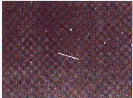
Ezt a 20' \times 15' -es képet május 19-én 12:14 UT-kor, mindössze 30 másodperc expozícióval készítette Takuo Kojima, egy 25 cm-es reflektorral és ST-6-os CCD-kamerával

Az utóbbi években már többször be számoltunk a holdpálya távolságában elszáguldó kisbolygókról, ám azok mérete sosem haladta meg a 10–20 m-t. A 200 m-es 1996 JA1 becsapódása esetén viszont igen nagy károkat okozhatna, a keletkező kráter mérete több kilométerre rúgna. A közelítés előtti 4,01 éves kerिंगési ideje a Föld gravitációs hatása miatt 4,10 évre módosult, így pár évtizedig biztosan nem lesz jelentős közelítése. 2000-ben már csak 0,41 Cs.E.-re fog elhaladni mellettünk.