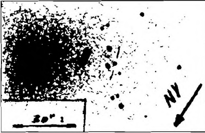
44,5 T, 230x (részletrajz, Szabó Gyula)

is ellenőrizték. Másnap újra felkeresték ezt az objektumot. Hmg: 7 m 0. (Bakos Gáspár, Szabó Gyula)