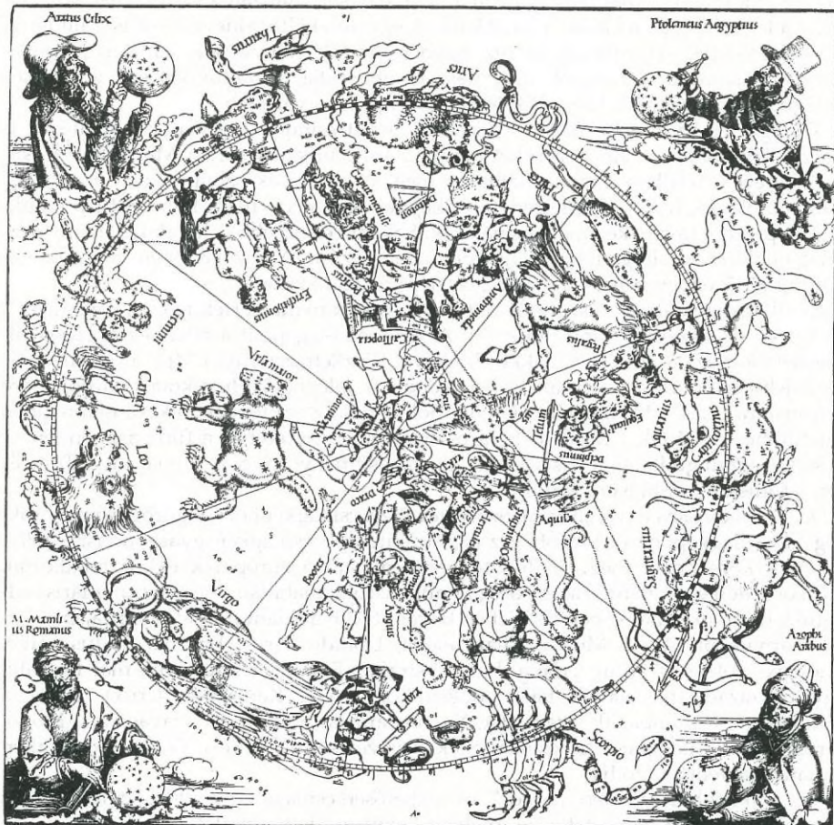
Az északi égbolt csillagképei Albrecht Dürer rézmetszetén (1517). Még hiányoznak róla olyan csillagképek, mint a Canes Venatici, a Lynx vagy a Camelopardalis. Az égboltot (az „éggömböt”) — a kor szokásának megfelelően — „kívülről” ábrázolja, ezért a csillagképek bal- és jobboldala felcserélődött

Ovidius feldolgozásában így olvasható a történet: Jupiter erőszakot követett el Callistón, akinek fia születik, Arcas. A féltékeny Juno kegyetlen bosszút áll az ártatlan lányon: medvévé változtatja. Később Arcas vadászat közben összetalálkozott anyjával, s már éppen le akarta nyilazni, amikor Jupiter mindkettőjüket az égbe emelte. Juno azonban még az égen is igyekezett vetélytársnője sorsát megkeseríteni. Kiszközlte, hogy sohase fürödhessen meg a tenger vizében. (A cirkumpoláris csillagok sohasem kerülnek a látóhatár alá.)