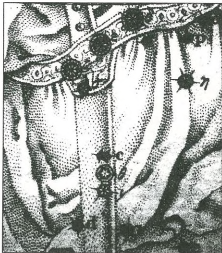
Az Orion-köd vidéke John Bevis 1750-ben készült térképén