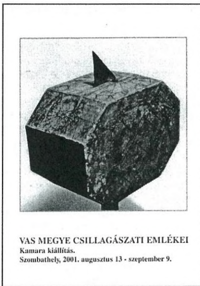
VAS MEGYE CSILLAGÁSZATI EMLÉKEI Kamara kiállítás. Szombathely, 2001. augusztus 13 - szeptember 9.

Az érdekes kiállítás vezető füzet nem csak egy megye csillagászati hagyományairól ad áttekintést, hanem a hazai csillagászati kultúra múltjának szép bemutatása. Kíváncsinos lenne, ha mennél több város és megye mutatna be hasonló kiadványt. (Beszerezhető a Gothard AmatőrCsillagászati Egyesület címén, Szombathely, MMIK Ady Endre tér 5.) (Bartha Lajos)