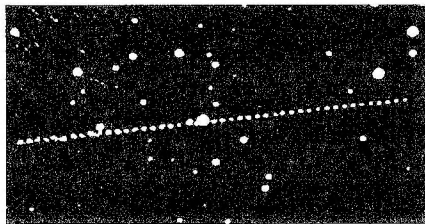
A 2002 NY40 útja a csillagos háttér előtti augusztus 16-án 20:32 UT-től 1 percenként exponálva 140/500-as Schmidt–Newtonnal és Amakam CCD-kamerával (Horváth Tibor–Tuboly Vince)

Augusztus. A 2002 NY40 elhaladása volt a legkisebb sajtóvisszhangot kiváltó, azonban észlelési szempontból a legkedvezőbb esemény. Felfedezése egy hónappal megelőzte augusztus 18-ai közelségét, ami egyrészt elegendő felkészülési időt hagyott az észlelőknek, másrészt kicsit megnyugtatta a bolygónk biztonságáért aggódókat: a rendszerek működnek, a „kintről” jövő veszélyeket idejében észlelni tudjuk. Az általános vélekedéssel ellentétben a Föld felé tartó égitesteket nem gyors mozgásukról lehet felismerni, illetve ha már