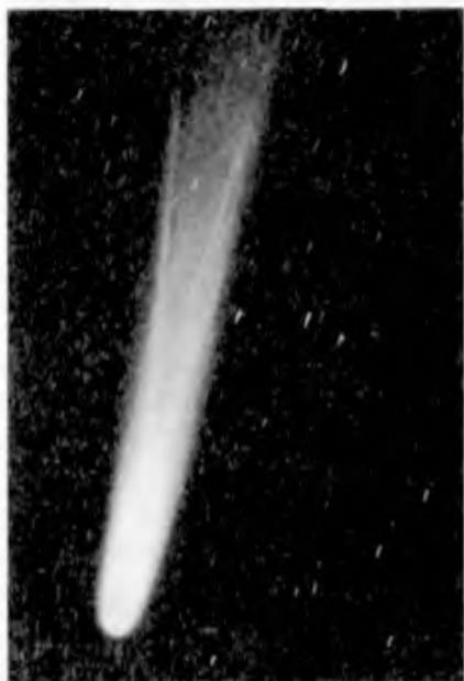
A Halley-üstökös 1910-ben

Az érdekesség kedvéért Mark Twain egy új „üstökősfajtát” is kitalált, amely jóval nagyobb, ragyogóbb a naprendszerbeli üstökösökhöz. Frdemes megjegyeznünk, hogy az üstökös-történetnek voltaképpen semmiféle jelentősége sincsen a kistrugény további részeinek szempontjából. Inkább csak színesítik, élénkítik a cselekményt, és jelzik az író különös figyelmeét az üstökösök iránt.