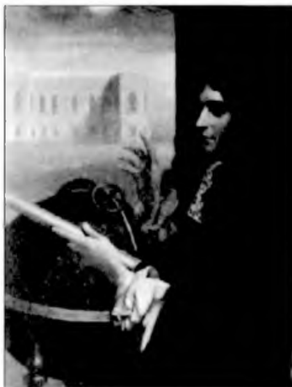
Giovanni Domenico Cassini korabeli portréja (a háttérben a Párizsi Obszervatórium)

Már ezekben a korai időkben is megmutatkozott a bolygók megfigyelése során alkalmazott távcsövek minőségének fontossága. Cassini, aki XIV. Lajos meghívására a párizsi obszervatóriumban dolgozott, olyan nagyszerű műszerekkel végzett