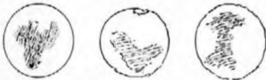
Christiaan Huygens 1659-ben, 1672-ben és 1683-ban készített, részleteket is tartalmazó rajzai

Christiaan Huygens (1629–1695) holland csillagász, a Szaturnusz gyűrűjének felfedezője, 1655 márciusában huszonhat évesen, jó minőségű 5,1 cm átmérőjű és 3,2 m fókuszu lencsés távcsövével 50x-es nagyítás mellett felfedezte annak legnagyobb holdját a Titánt. Ugyanakkor ő volt az első, akinek részleteket sikerült megfigyelnie a Mars korongján. Az 1659. november 28-án készített rajzán ábrázolt „Oráveg-tenger”, vagyis a Syrtis Major segítségével az oppozíció során először tett kísérletet a Mars tengelyforgási idejének meghatározására. Úgy találta, hogy az a Földével nagyjából megegyező, azaz 24 óra. 1672-es megfigyelései során a Mars sarki hósapkáit is felfedezte.