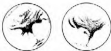
William Rutter Dawes a Mars 1864/65. évi oppozíciója alkalmával készített két rajza

Az 1862. évi, majd a soron következő 1864. évi oppozíció észlelői között ott találhatjuk William Rutter Dawes (1799–1868), aki egy 20 cm átmérőjű Cook-féle refraktorról legtöbbször 258x-os nagyítás mellett végezte rendkívül precíz megfigyeléseit. Az általa készített korongrajzokból Richard Anthony Proctor (1837–1888) állította össze a Mars következő jelentősebb térképét. Az 1867-ben kiadott Proctor-féle térképen, elentében Mädler térképével, már elnevezések is szerepeltek, melyek a Mars addigi megfigyelőiről kapták a nevüket. A sötétebb területek tenger és óceán, míg a világosabbak kontinens néven kerültek a térképre. A Proctor által bevezetett elnevezéseket többen joggal kritizálták, így maga Schiaparelli is. A térkép elnevezései ui. a legtöbb esetben angol csillagászokról emlékeztek meg. Csak Dawesről hat alakzat kapott nevet a Proctor-féle térképen! A későbbiek során a Mars-területek elnevezésének egységes és véglegesen elfogadott nomenklatúráját éppen maga Schiaparelli vezette be.