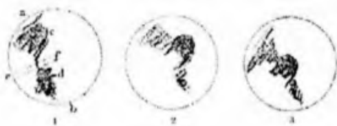
Herschel 1777-ben (1) és 1779-ben (2, 3) készített Mars-rajzai

Az 1781-es földközelség alkalmával ő is megállapította a bolygó tengelyforgási idejét; eredményül 24 óra 39 perc 21,67 másodpercet kapott, ami csupán két perccel hosszabb a valós értéknél. Noha Herschel Marssal kapcsolatos megfigyelései rendkívül fontosak, ez az év mégis egészen másról lett