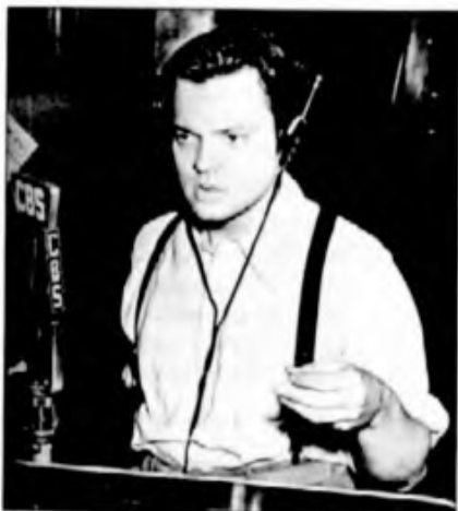
Orson Welles, a tömeghisztériát keltő rádiójáték színész-rendezője

„A világok harcát” többször is feldolgozták. A későbbi rádióműsorok már nem voltak annyira erőteljes hatásúak. Jeff Wayne egy jól sikerült rockopera jellegű zene-művet írt a regény alapján. A Sztrogackij fivérek pedig koruk szatirikus kigúnyolását rejtették Wells regényének folytatásába (A marslakók második inváziója).