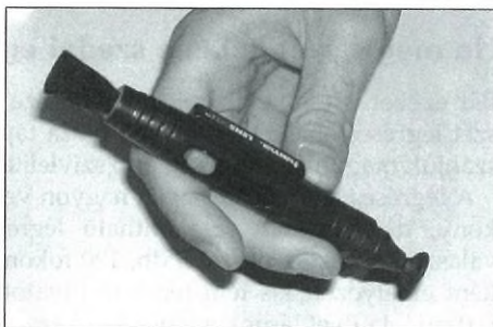
Ezt az objektívtisztító eszközt csillagászati optikákhoz NE használjuk!

De nézzük, mit is tehetünk. A 8 cm alatti objektívek általában ragasztottak, ezeket minden kockázat nélkül kivehetjük a foglalatból – természetesen csak megfelelő szakértelem, és szerszám birtokában –, és a tükröknél leírt módszerrel megtisztíthatjuk, azzal a különbséggel, hogy ha a T, vagy MC réteg foltos maradna, akkor azt a 100%-os pamutszövettel, a felületet meglehelve átsimítjuk. Ez utóbbi műveletet ajánlott cérnakesztyűben végezni, nehogy a szövet kezünkkel érintkező része összezsírozza a már szépen megtisztított felületet. Tartsuk szem előtt, hogy a kesztyűben ügyetlenebb a kéz,