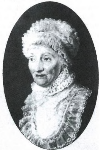
A nyolc üstököst felfedező Caroline Herschel

A 19. században többször is látszott szabad szemmel, 1829-ben például 3 m ,5-ig fényesedett, a 3,3 évenként bekövetkező napközelségek miatt azonban gyorsan veszít fényességéből, így a 20. században már nem fényesedett 5 magnitúdó fölé (erre leg-