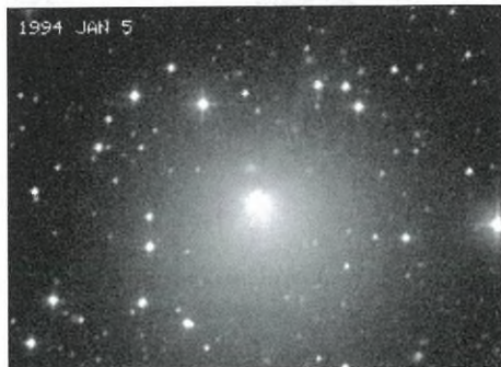
Az üstökös 1994. január 5-én, a 91 cm-es Spacewatch-teleszkóppal

naptávolságban éri el a felszálló és napközeli leszálló csomópontját. Ezekből az adatokból következik, hogy amikor perihélium előtt kerül földközelségbe, akkor az északi féltekéről, amikor utána, akkor a délről látható kedvezően, ahogy az 1997-ben történt, amikor a Naptól távolodó kométa 0,19 Cs.E.-re megközelítette bolygónkat. Jelenlegi pályája ugyan 0,173 Cs.E.-nél nem közelíti meg jobban a földpályát, az üstököshöz mégis kapcsolható egy igen öreg, rendkívül komplex meteoráramlat, a Taurida meteorraj, amely a mostani visszatérést teheti még érdekesebbé, hiszen egy kis szerencsével az üs-