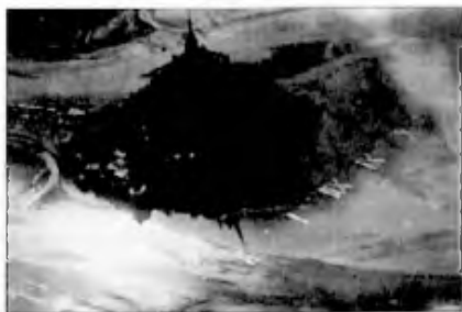
Az óriás napóra madártávlatból

ezrei, hogy Szent Mihály zászlaja alatt, szent énekeket énekelve, mezítláb járják körül az éles kavicsokon. A legnagyobb ünnep természetesen Mihály nappal van, szeptember 29-én.