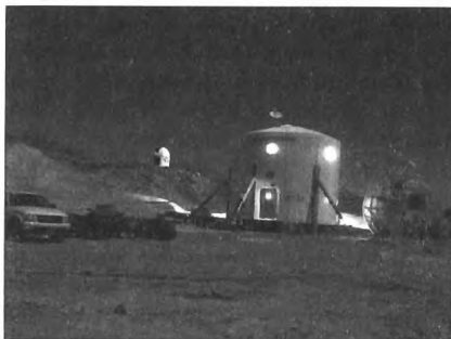
A lakómodul éjszaka, háttérben a kis csillagvizsgálóval

A kísérlet fontos részét képezte a terepi mobilitás vizsgálata, ehhez egyszemélyes ATV-ket (All Terrain Vehicle, azaz minden területen használatos járműveket) is használtunk. Bár a szakfanderben a munka csak kicsit volt nehezebb, mint nélküle, a járművek nagyon hasznosak voltak: még néhány 100 méterért is szívesen ült rá az ember. A marsexpedíció során nélkülözhetetlenek lesznek majd a nagy, ún. nyomás alatti járművek is, amelyek egy mini HAB-ként is elképzelhetők, kerékkel az alvázukon. Mivel ilyen nekünk nem volt, a hosszú EVA-ra hagyományos autóval, az MDRS nyúzott terepjárójával mentünk. Mivel ezen nem volt zsilipkamara, szakfanderben kellett utazni – a környékbeliek nem kis meglepetésére.