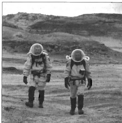
Séta a „Marson”

Az ember elszigetelt környezetben rákényszerül az innovatív megoldásokra: készítettem pl. légelterelőt a sisakomba, hogy a ventilátor ne fújja arcomba a friss levegőt. A felszerelés egy részét (óra, jegyzetfüzet, mérőszalag stb.) a szkafander külső felületére rögzítettem, a maradéknak pedig kis „EVA kosarat” gyártottam. A kémiai laborból lopott eszközökkel egyszerű ivó rendszert építettem a szkafanderbe, eleinte a többiek multságára, később irigységére. Az elszigeteltség is a kísérlet része volt, a vészhelyzetre szolgáló „piros adóvévő” jelentette az egyetlen azonnali kapcsolatot a külvilággal – szerencsére ezt nem kellett használnunk. Az utazás előtt sok mindenre gondoltam, ami zavarhat vagy kényelmetlen lehet a szimuláció alatt. Magam is meglepődtem, de egyetlen dolgot bírtam csak nehezen: a tudományos munkát korlátozó szabályokat. Néhány alapszabály ugyanis nehezítette az egyszerű, hagyományos munkavégzést. Mind közül a legrosszabb az volt, hogy egyedül nem lehetett