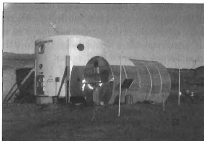
A lakóegység, mely két héten át volt otthonom

A szimuláció a lakóegységen kívül is zajlott: EVA (Extra Vehicular Activity) azaz űreszközön kívüli tevékenység keretében lehetett csak elhagyni a HAB-ot. Szkafanderünk szintén csak néhány dolgot szimulált, főleg a mozgást, a munkát nehezítette és a kilátást zavarta. A háti életfenntartó egységben akkumulátor volt, és ventilátorok, amelyek a sisakba fújtak friss levegőt, emelkedőn gyalogolva mégis olyan intenzíven lélegzett az ember, hogy gyakran majd' bepárasodott az üvegbúra – ezért a belső felületet mosogatószappannal kentük be még az EVA-k előtt. A szkafander viselés további kellemetlen velejárója, hogy az alsóruházatot nem hagyja el a kiizzadt vízpára. Szerencsére számítottam erre, és az utazás előtt célirányos ruhadarabokat készítettem magamnak – így is gyakran megizzadtam, a többiekről nem is beszélve. Nem sok vizünk volt a zuhanyzáshoz (akárcsak a régi ráktanyai táborokban), ezért néhány nap után intenzív illatokat kezdtünk eresztetni. Annyira ritka volt a normális zuhany-