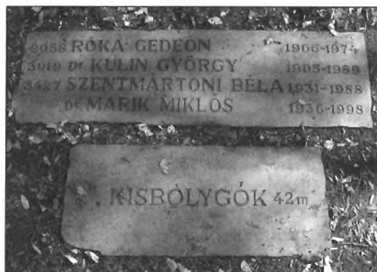
A kisbolygók jelzőkövei a népligeti Sétáló Naprendszerben – a Naptól 42 m-re

A Népliget árnyas fái alatt sétálva bizonyára már sokan végigjárták a Planetáriumtól induló Naprendszer túrát, amely Mátis András tervei alapján készült el 2002-ben. Figyelmesen olvasva a bolygók távolságát és méretét szemléltető tábláskákat, a kisbolygók közt megtaláljuk a Marik kisbolygót is, amely az 1998-ban tragikus hirtelenséggel elhunyt tanár, csillagász nevét viseli. Nem véletlen, hogy előbb tanár, és csak utána csillagász. A legtöbbször számára Ő tanár volt, mégpedig a legkedvesebbek közül való, akinek felejthetetlen előadásairól legendák keringtek az egyetemen. Nem véletlen, hogy a sok magyar vonatkozású kisbolygó közül Mátis András is pont a Marik kisbolygót választotta. A kisbolygóval számos hazai honlapon is találkozhattunk, és általában mindenki úgy tudta, hogy a Kulin György által 1940. január 6-án felfedezett 10258-as sorsszámú 1940 AB kisbolygót Marik tanár úrról lett elnevezve. Ezek után kicsit furcsának tűnhetett, hogy tavaly novemberben szinte minden médium foglalkozott a hírrel, miszerint a 28492-es sorsszámú kisbolygó ezentúl Marik Miklós nevét viseli. Az ellentmondás tisztázása végett vissza kell utaznunk az időben, egészen 1940-ig.