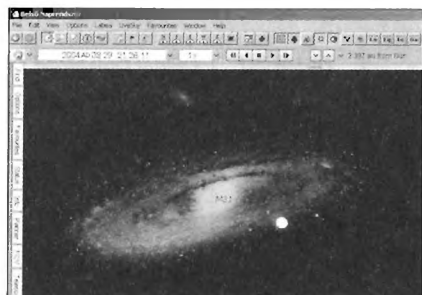
A mély-ég objektumokat valódi fotókon is szemlélhetjük

Internetről. Alapértelmezés szerint a frissítések megjelenését 14 naponta ellenőrzi, de ez a lehetőség ki is kapcsolható File/Preferéncs menüben.