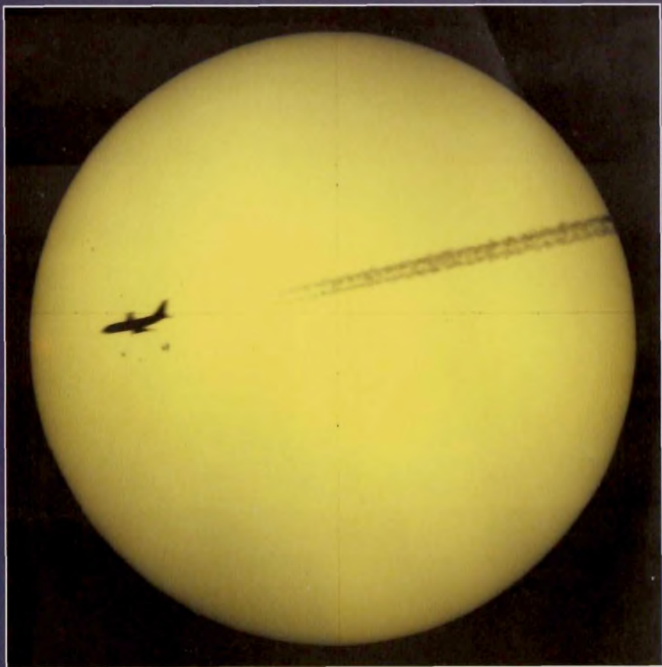
A képet Kálmán Béla készítette a rendszeres észlelés során, 2005. január 11-én 11:08:20 UT-kor, a debreceni napfizikai obszervatórium 12,5 cm-es Nap-fényképező refraktorával, Zeiss-interferenciaszűrőn át, Agfa Alliance Camera CS filmre, 1/60 s expozícióval. A repülőgép „alatt” látható foltcsoport a hónap közepére óriási, szabad szemmel is látható napfolttá fejlődött