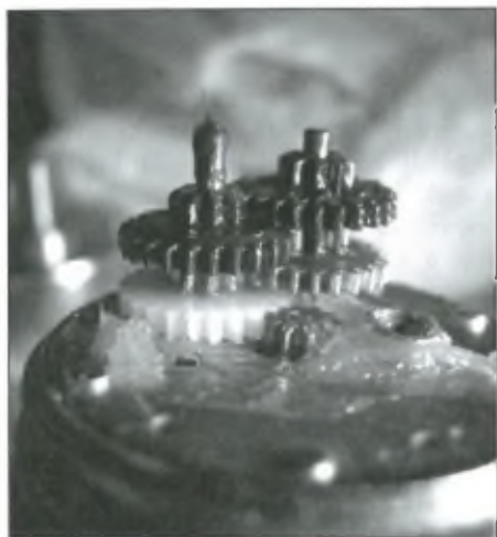
A léptetőmotorokra szerelt áttételrendszer felelős a véletlenszerű hibák többségéért

pek készítéséhez (felbontástól függően) csak kisebb sikerrel használhatjuk, sok bemozdult képtől kímélhetjük meg magunkat, ha vezetünk fotózás közben.