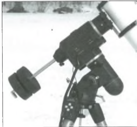
Az EQ6 profilból

dozható kategóriába tartozik és egyéb paraméterei is megfeleltek, ezért én ezt választottam.