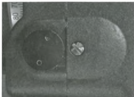
Balra a krómozott csavar, jobbra pedig az általa rejtett ellenőrző furat

felszerelését – melyek együtt 15 kg-ot nyomnak – játszi könnyedséggel elbír, még szeles időben is meglepően merev marad a szerkezet. Vizuálisan még extrém nagy nagyításoknál is minimális remegés mellett lehet fókuszálni, ami nagyon hamar lecsillapodik. A 7,5 kg-os acél háromláb rendkívül merev, persze teljesen kihúzott állapotában már észrevehető némi stabilitás-csökkenés. Egy könnyebbre épített 25 cm-es f/5 - f/6 -os Newtont is minden bizonnyal még jól megtart a mechanika.