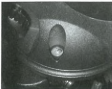
Az EQ6 libellája

A pólustávcsövet nagy kupak védelme alatt helyezték el, ezért nem sérülékeny, nehezen állítódik el. Ráadásul az újabb