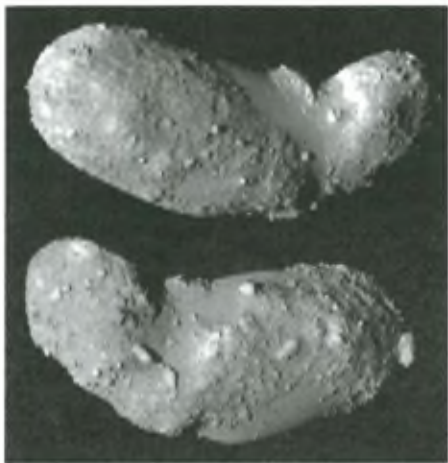
Az Itokawa kisbolygó két irányból

lálkozóhoz, emellett kipróbálta AMICA kameráját, és megörökítette a Földet és a Holdat. Útja során csak kisebb problémák léptek fel, ám a közelítés alatt három giroszkópja közül kettő is felmondta a szolgálatot.