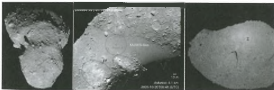
Kiálló sziklák hosszú árnyékkal (balra), az egyik tervezett leszállóhely a Muses-tenger területén (középen) és a Hayabusa saját árnyéka, amelyet az első közelítéskor örökített meg (jobbra)

Már most kijelenthetjük, hogy az űreszköz sikeresen vizsgázott. A Hayabusa műszerei közül az AMICA képrögzítő berendezés eddig mintegy 1500 felvételt készített többféle színszűrővel. Az NIRS spektrométer, a közeli infravörös tartományban több mint 75 ezer mérést végzett, a LIDAR lézeres távolságmérő pedig a kisbolygó felszínén 1,4 millió pont helyzetét, távolságát állapította meg. Az XRS nevű röntgenspektrométer összességében 700 órán keresztül rögzített színeképi adatokat, amelyekből eddig az olivin és a piroxén ásványokat sikerült azonosítani. A Hayabusa mozgásának elemzése alapján az Itokawa közepes sűrűségét is sikerült megállapítani, amely 2,3 \text{ g/cm}^3 -nek adódott, 0,3 \text{ g/cm}^3 pontossággal. Ez lényegesen alacsonyabb, mint amit egy ilyen, S típusú kisbolygónál vártak a kőzetanyag alapján. Az ionhajtómű eddig összesen 26 ezer órán keresztül üzemelt, és sikeresen tesztelték a módszert, amivel felváltva használták az új meghajtást és a hagyományos kémiai rakétahajtóművet. Elképzelhető, hogy a jövő űrszondáit is többféle meghajtási elven működő hajtóművel látják el, s ezeket a szükségletek szerint váltogatják.