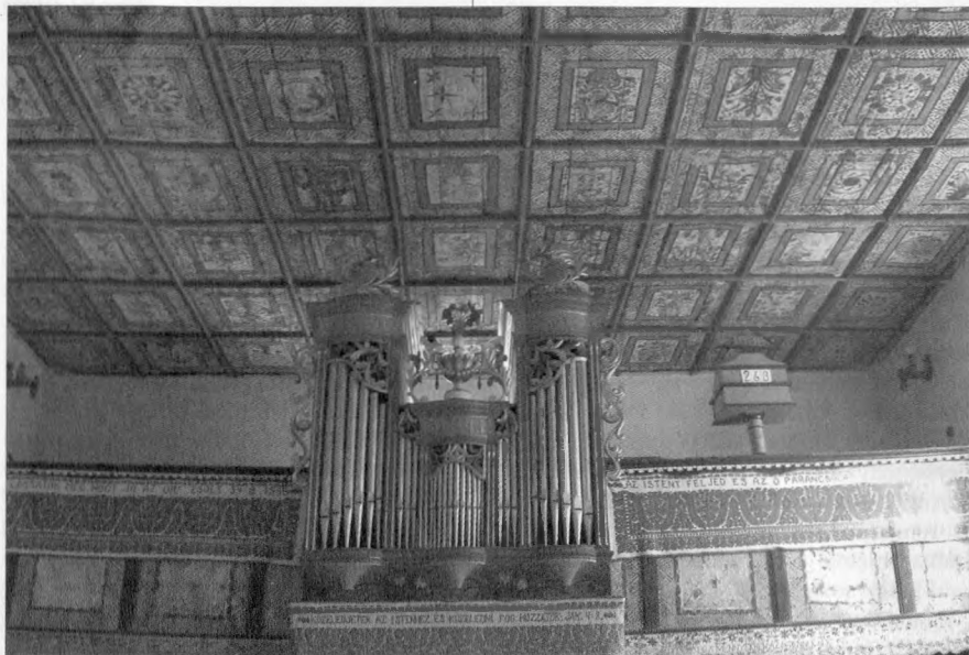
A kőröspói templom orgonája és kazettás mennyezete. Hold-ábrázolás a felső kazettasor középső kazettáján

templom mennyezetére elég egyetlen pilantást vetni: a virágminták és állatszimbólumok között Nap-arc, Hold-arc, torzarcok láthatók, máshol Nap, Hold és csillagok együttes ábrázolása vagy hétbolygó-rendszer ábrázolás figyelhető meg. Némely (pl. a magyarvalkói) templom oldalsó és homlokzati bejáratát Nap- és Hold-ábrázolások díszítik. A templomok faragott kapuján is gyakran stilizált csillag (Nap?) jelenik meg, az átmenet a naprózsák és a „virágminták” között egyáltalán nem éles. Mindenképpen figyelemre méltó azonban ezeknek az ábrázolásoknak a kiemelkedő aránya: a díszítések mintegy harmada (szubjektív becslés) mögött lehet valamilyen csillagászati szimbolikát sejtteni.