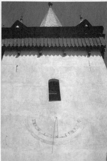
Napóra a kalotaszentkirályi templom tornya alatt

Sajnos legújabbán az ortodox hit terjesztése céljából a nagyobb falvakban, városokban a régi templomokat módszeresen neobizánci stílusban átépítik, ízléstelen hibrid szörnyetegeket hozva ezzel létre, és ki tudja, milyen értékeket téve tönkre a művelettel. Még az a jobb, ha új épületet készítenek; bár az Erdély alapvetően nyugati kultúrájától és a tájtól egyformán idegen, általában rendkívül ízléstelen, bádogtetős, hagymakupolás monstrumok helyét gyakran úgy választják meg, hogy teljesen eltakarja és „agyonynyomja” a régi református templomot. A városiasodás is terjed magától, s ami egyrészt haladás lesz, óhatatlanul rombolja a régit, az