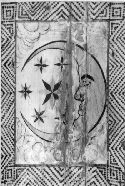
Hold és csillag ábrázolása a magyarvalkói templom mennyezetkazettáin

véért meg kell említeni a Magyar Néprajzi Lexikon értelmezését, amelyben a mondott motívum gránátalma értelmezése szerepel, s a néprajzi munkákban általában ezt a szimbolikát fogadják el.