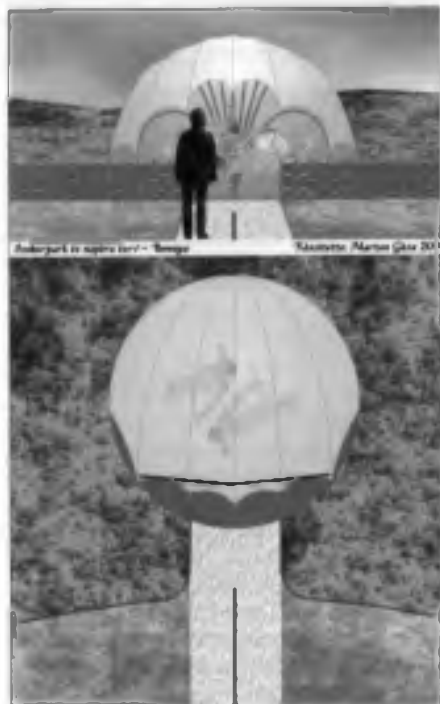
Az órákat elől és fölül szobrokkal gyönyaszátorok fogják védeni az időjárás viszontagságától

ságát. Emellett ki kellett találni, hogy a vesszőből vagy huzalokból font alakokkal az időjárás viszontagságai ne károsítsák. Ezzel együtt a látvány fő hangsúlya mindenképpen a szobrokon kell hogy maradjon. Végül egy-egy nagy méretű, falevelhez hasonlító védőszátor mellett döntöttünk. Ezek a sátorok kellő védelmet nyújtanak majd, miközben lehetőség nyílik a szobrok körbejárására és a központi „árnyékvetítő” szobor felől jó láthatóságokra is megoldást jelentenek.